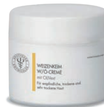
50 ml Tiegel